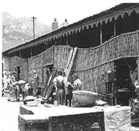
Vrouwenkamp in Ambarawa of het nabijgelegen Banjoebiroe. In de provisorisch met bamboematten afgeschermd galerijen van barakken werden vrouwen en kinderen gehuisvest.

Niet alleen de scheiding van familie ver weg, maar vooral de scheiding van geliefden in Indië was reden om een dagboek te beginnen. Militairen werden namelijk krijgsgevangen gemaakt en weggevoerd van vrouw en kinderen. Bij de internering van de Europese burgerbevolking werden de mannen afgezonderd van de rest van hun gezin ondergebracht en van contact tussen de kampen was zo goed als geen sprake. Voldoende reden voor velen de eigen belevenissen op te tekenen om na de oorlog de naasten te kunnen laten lezen. De belevenissen en uitzonderlijke gebeurtenissen op zich vorm-