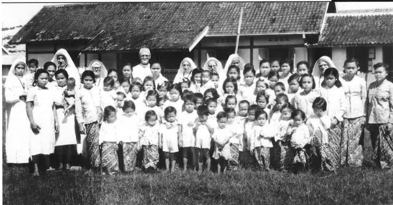
Enkele Zusters Onder de Bogen met internaatskinderen bij de St. Jozefkliniek te Cicadas, Java, vermoedelijk jaren dertig.

zusters van de jongeren en geeft hen een eigen identiteit. Dit uit zich bijvoorbeeld bij feesten, waarop stevast een Nederlands en een Indonesisch buffet geserveerd worden. De jongeren kiezen voor de vertrouwde Indonesische maaltijd, terwijl de ouderen aanschuiven bij de schotels met aardappelen, doperwtjes, braadlapjes en jus.