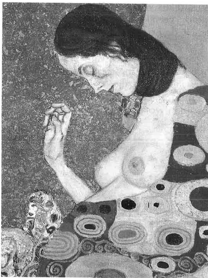
Egon Schiele, De dood en het meisje , 1905

De vrouw wordt op een voetstuk verheven. Bijna letterlijk, want de voorstelling van de vrouw als standbeeld duikt telkens opnieuw op. Maar ook hier is de ambivalentie tastbaar. Het beeld staat alleen; het is hard, koud en gevoelloos. Prosper Mérimée's La Vénus d'Ille (1837) zet de toon voor latere bewerkingen van het thema. Het bronzen Venus-beeld dat wordt opgedolven oefent een magische werking uit op mannelijke voorbijgangers. Wanneer een jongeling de trouwring, bestemd voor zijn aanstaande bruid, om de vinger van het beeld schuift, weigert de zwarte Venus die terug te geven. En in de huwelijksnacht treft hij niet de echte bruid in bed, maar het idool. De volgende ochtend blijkt hij dood, gesmoord in een bronzen omarming. De inscriptie op de sokkel had hem moeten waarschuwen: cave amantem . Het thema keert onder meer terug in La Belle Impéria (1892) van Camille Lemonnier en La Femme de marbre (1900) van Henri de Régnier. Als standbeeld is de vrouw een frigide figuur die haar geliefden tot wanhoop drijft. Nana, die in een tableau vivant Venus uitbeeldt, weet met "haar marmeren lichaam" allen aan zich te onderwerpen, want haar uitstraling