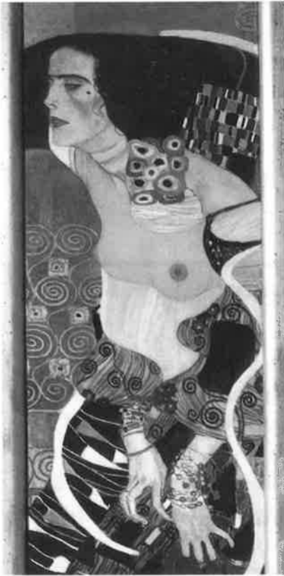
Gustav Klimt, Judith II (Salomé) , 1909.

is sterk genoeg "om iedereen te vernietigen". Maar het is de man, die haar die macht verleent. Voorgesteld als standbeeld is Nana niet langer zichzelf, maar het object van zijn fantasie. Het gaat om projecties van de verbeelding, in het bijzonder de verbeelding van de genoemde schrijvers en kunstenaars. Niet voor niets spreekt Huysmans in dit verband over "cerebrale onanie". Het is zijns inziens de zwaarste zonde, die hij in Là-bas nader omschrijft als Pygmalionisme. De kunstenaar die het beeld van de vrouw creëert, loopt namelijk altijd gevaar verliefd te worden op zijn eigen