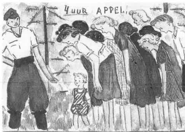
Het dagelijks appèl in Ambarawa 6