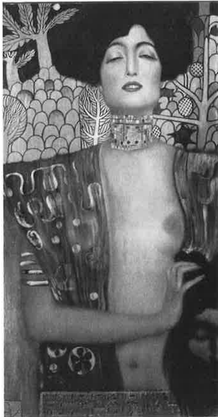
Gustav Klimt, Judith II , 1909.

De seksueel actieve vrouw wordt geassocieerd met vuil, ongedierte en ziekte. In Émile Zola's gelijknamige roman van 1880 is de hoer Nana de vlees geworden geslachtsziekte. Zij is "de gouden vlieg", die is geboren in de drek van het riool en die "de dood van de krenge meevoerde, en gonzend en dansend de mannen vergiftigde door alleen maar op hen te gaan zitten". Nana dringt door tot in de hoogste kringen en besmet zelfs de voorheen zo fatsoenlijke vrouwen, die zich door haar